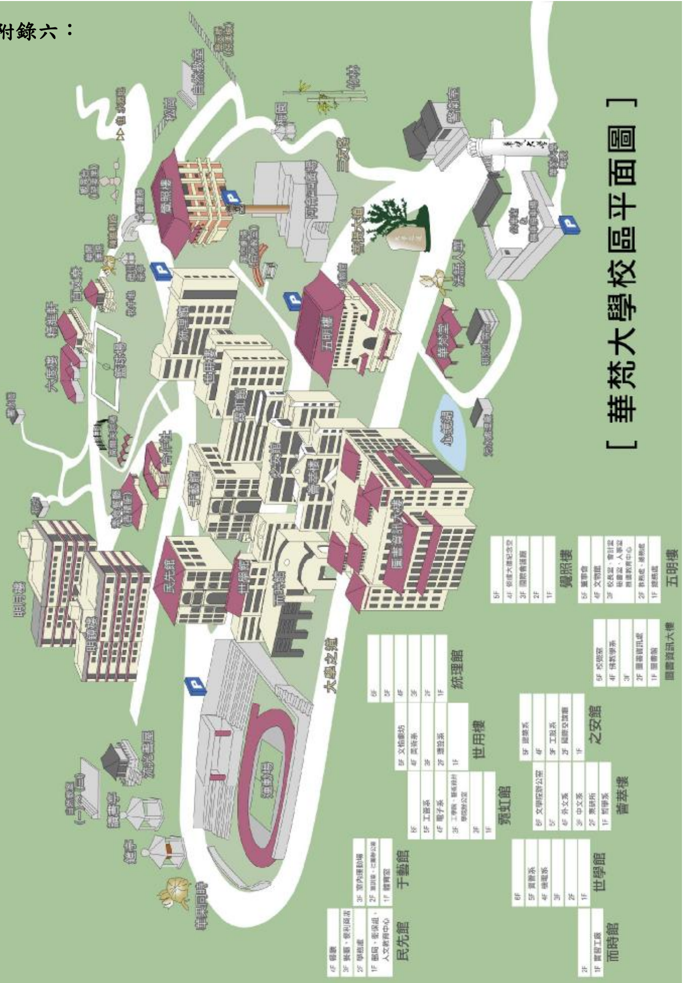
[ 華梵大學校區平面圖 ]